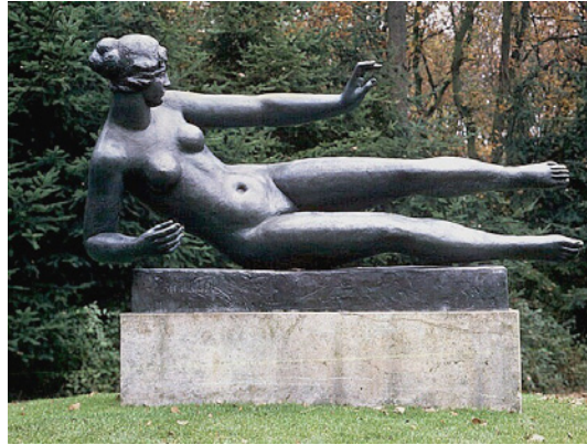
Aristide Maillol De lucht