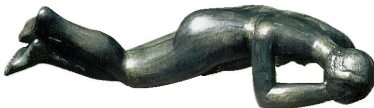
Constant Permeke, 1886 - 1952 Niobe , 1951

16 Bekijk het werk van alle kanten. Aan welke kant zie je het best de emotie?