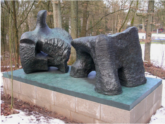
Henry Moore Tweedelige liggende figuur II

18 Tot slot: zou het nu dan lukken zelf een kunstwerk te dateren? Je hebt de keuze tussen twee dames: Henry Moore's 'Two-piece reclining figure' (de liggende dame – in 2 delen – op de heuvel naast het gazon!) of 'l'Air' van Aristide Maillol (op dit veld). Zoek ze met behulp van de twee foto's, kijk niet op het bordje en gok het jaartal.